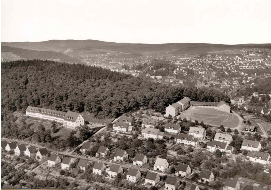
Abb. 3: Blick auf die Winchenbachsiedlung 1956. Der Baubestand der Siedlung wurde durch die 1954–56 errichtete Evangelische Winchenbachschule (Bildmitte rechts) erweitert. Der auffällige Riegel (Bildmitte links) war das 1951/52 gebaute städtische Altersheim – in den ursprünglichen Planungen der 1930er Jahre als „Gemeinschaftshaus“ vorgesehen.

Bisherige Planungen wurden modifiziert: Das im Bebauungsplan von 1938 vorgesehene, aber bis 1945 nicht realisierte Gemeinschaftshaus als Zentrum der Partei vor Ort und Raum für Versammlungen und die politische Feierkultur wurde 1951/52 gebaut, erhielt aber eine völlig andere Funktion: Es wurde als städtisches Altenheim genutzt. Die für das Viertel geplante Schule wurde 1954–56 errichtet, allerdings unter den vollkommen anderen Vorzeichen einer evangelischen Bekenntnisschule und mit erweitertem Einzugsbereich. 75 Die Formierung der Winchenbach als eigener Pfarrbezirk 1954 sollte die symbolische Rückkehr zu Christlichkeit und Humanismus zeigen. 1960 wurde beschlossen, für diesen Pfarrbezirk statt der Notbehelfe des angemieteten Saals des Cafés